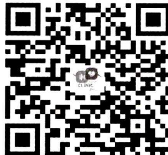
เพจ facebook คลินิก สตผ.