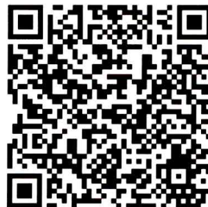
Link ZOOM และเอกสารที่เกี่ยวข้อง