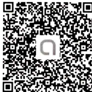
ไลน์ Openchat คลินิก สตผ